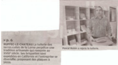
» p. 6 RUFFEC-LE-CHATEAU La tuilerie des terres cuites de la Lorne perpétue une tradition artisanale qui remonte au XVIII e siècle. Ses briquettes sont expédiées en Californie et l'astrophysie se diversifie, proposant des plaques à pizza.