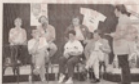
Les acteurs du Parc naturel régional de Brenne.

Les acteurs du Parc naturel régional de Brenne ont organisé hier de la nouveauté d'une exposition née en 1980 d'une forte volonté locale. Le Parc naturel régional de Brenne a organisé hier une exposition intitulée "On n'a pas tous les jours 10 ans". Cette exposition, née en 1980, est le fruit d'une forte volonté locale. Elle est présentée au Château-Naillac, à la suite de la visite de la chapelle de la Vierge. Le Parc naturel régional de Brenne a organisé hier une exposition intitulée "On n'a pas tous les jours 10 ans". Cette exposition, née en 1980, est le fruit d'une forte volonté locale. Elle est présentée au Château-Naillac, à la suite de la visite de la chapelle de la Vierge.