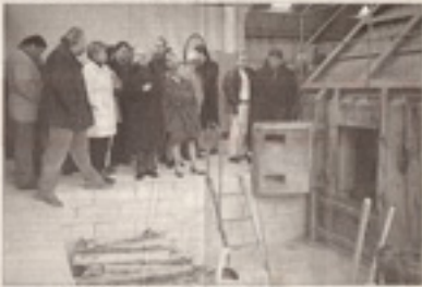
Un atelier de tuilerie traditionnelle en activité à Ruffec.

Le Tuilerie de la Lorne fonctionne depuis plus de 200 ans à Ruffec-Château. Sa terre accompagnée d'importants travaux est en gage de pérennité.