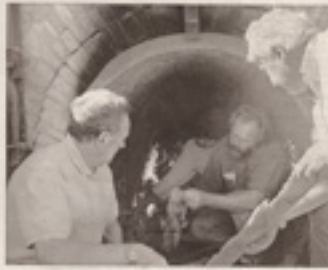
Le couple de La Tuilerie-Village de Rufec.