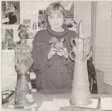
Les épis ont été réalisés par l'École de Brenne.

Le Parc de Brenne tient à ses épis de faïence. Deux pièces traditionnelles, posées sur des bords de Blanc, ont été réalisées à l'antique.